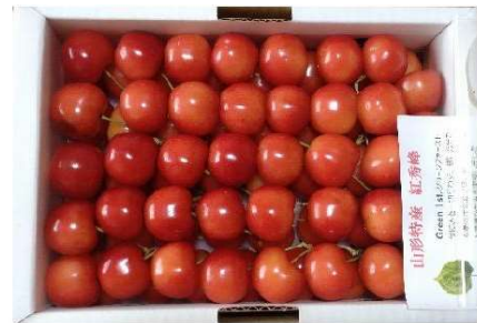
【東根のサクランボ】

年が明け、6月のある日「見事なサクランボ🍒」が届いた。贈り主は前の年の12月に草津温泉でお会いした方からで、山形県の東根市の住所であった。それ以来約10年間毎年サクランボをはじめリンゴやコメが贈られてきた。こちらからも群馬の特産品やギフト商品を贈った。