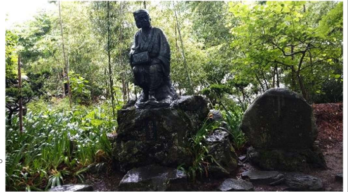
【立石寺の芭蕉の像と歌碑】

12年ぶりの再会は約1時間であったが、Oさんご夫妻の記録（写真）と記憶をしっかりと残し、12年間の区切りとしつつ東根市を後にその日の宿へと向かった。