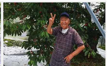
【S16年生まれの元気なOさん】