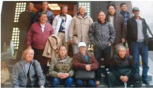
【2011年同期忘年会（草津温泉）】

カラオケも仲間が一巡して会場を出ようとした際、私は1人の男性の方から声をかけられた。その方曰く「後でサクランボ🍒を贈るから住所を教えてほしい」とのことだった。突然の事で戸惑いつつも自分の住所を教え、念のため相手の住所をメモした。