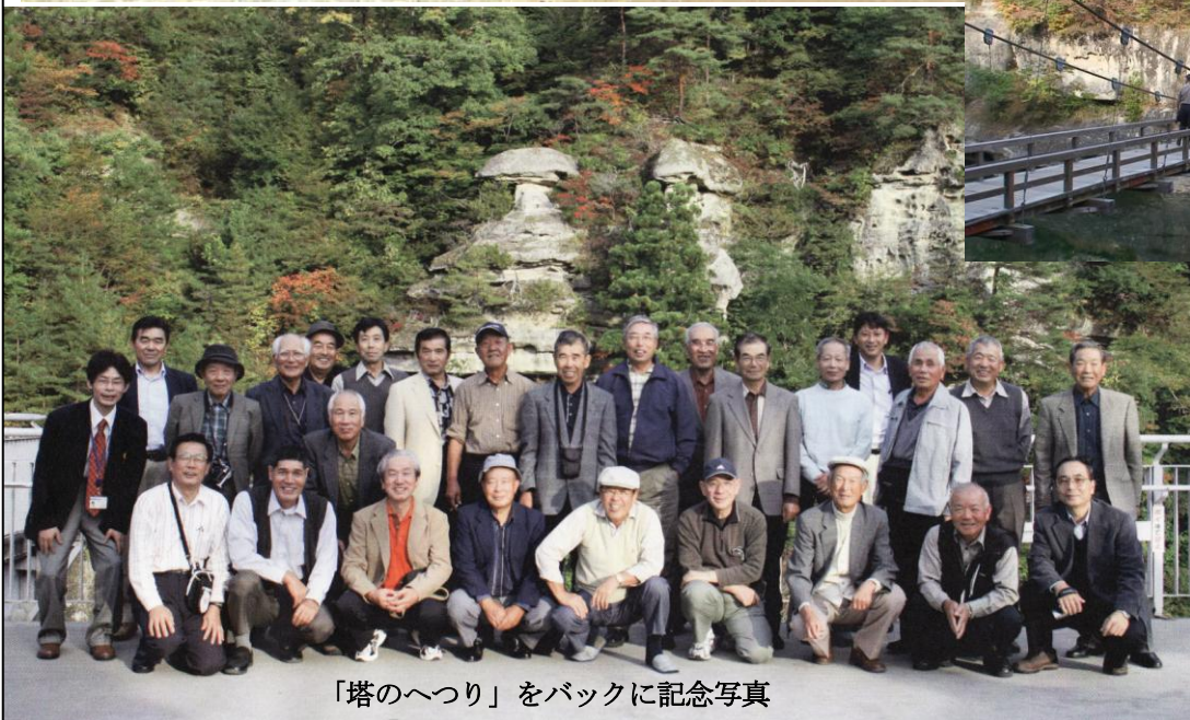
「塔のへつり」をバックに記念写真

ホームページ上で、<ここ> をクリックすると写真をスライドショーでご覧になれます。 (25枚あります)