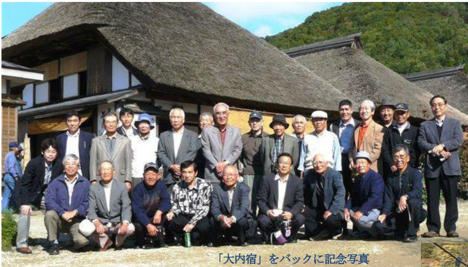
「大内宿」をバックに記念写真

翌日も天候に恵まれ気分よくホテル出発、江戸時代の宿場を今に残す「大内宿」へ。宿の人に聞きました「大内宿の自慢」はと、答えは集落の人の団結力と協力、共存している事だそうです。ちなみに茅葺屋根でありながら昔から火災を1つも出していない事と、空いた家が1軒も無いことと言っていました。タイムスリップしたかの様な大内宿で買い物をし福島県を後にして、次に龍王峡の見学と昼食。みなさん2日目はアルコールなし、元気で急な石段を降り雄大な龍王峡を散策し、足腰の強さに少し自信が持てた？ようです。バスは往路と同じで一路馬電へ、今回もバスの中、懇親宴会、風呂、その他色々な所で旧交を温められた楽しい旅となりました。