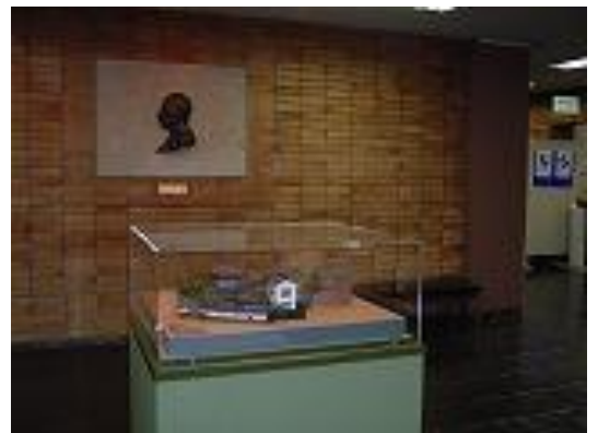
[ 鷗外記念館 ]

(注) 漱石の蔵書・遺品類は弟子の小宮豊隆の関係で東北大学で管理しているとのこと。