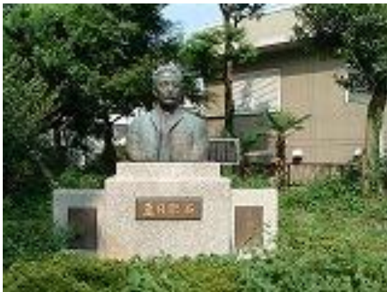
[ 漱石公園 ]