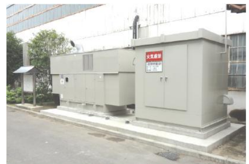
プレス工場に設置した発電機

これらの施策の中で特に重要視しているのが、省エネキャンペーン「Ene ダイエット MADEN 2011」の取り組みです。皆さんからの優れた節電アイデアを募集し、これを実現していこうというものです。皆さんの知恵と工夫を結集してできるだけ機器に頼らない節電をしていきたいと考えています。