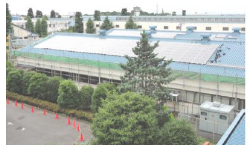
稼働開始直後の工機工場屋根上の太陽光発電