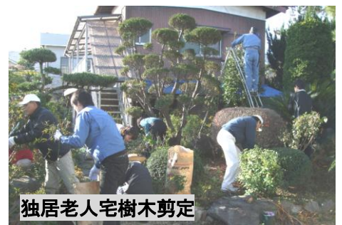
独居老人宅樹木剪定