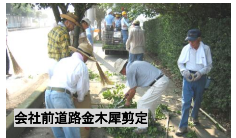
会社前道路金木犀剪定

菱の実会とボランティアの関わりは、1998年のMGV(三菱電機群馬ボランティア会)発足時まで遡ります。以来MGVからの参加要請に基づき、多くの方にご協力をいただいて関わりを継続しております。中でもMGVのメイン行事とも言われる、町内(旧尾島地区)独居老人宅の樹木剪定・会社前道路(県道)の金木犀剪定には、毎回菱の実会からも多くの方が参加。活動の大きな原動力になっております。ボランティアへの参加は、社会貢献という捉え方もありますが、併せて活動を通じ現役世代の方々・菱の実会会員相互のふれあいの場であり、情報交換の場でもあります。日頃ご無沙汰をしている方との顔合わせの場！！そんな感覚で今後も無理のないご協力をお願いいたします。次回のボランティアは、10月下旬から11月初旬に掛けて、独居老人宅の樹木剪定が予定されております。“別途ご案内いたしますので、ご協力をお願いいたします” (ボランティア担当 高柳)