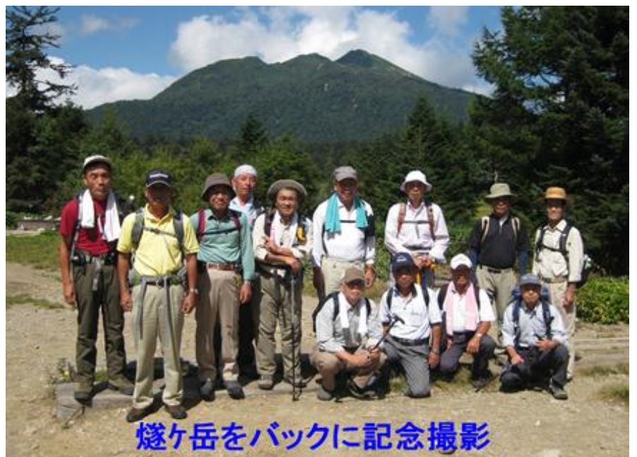
燧ヶ岳をバックに記念撮影