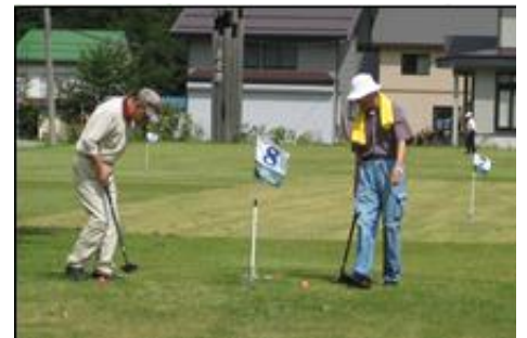
<グランドゴルフ大会> ←左は桧枝岐村の特設グランドゴルフ場。大会終了後の記念撮影です。