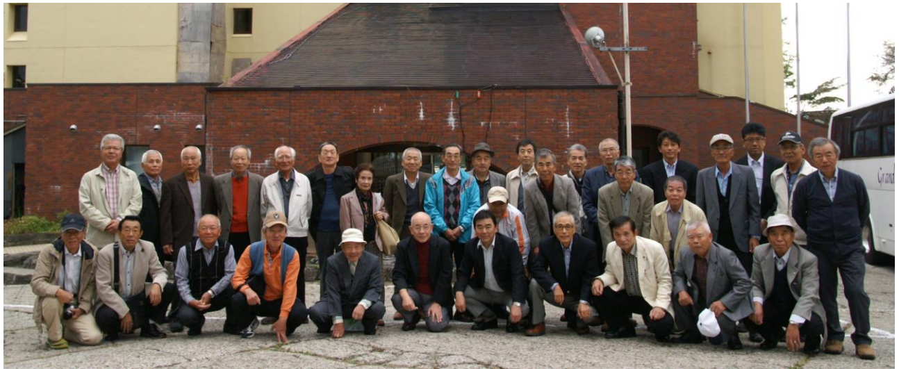
<旅行の写真をスライドショーに編集し、YouTube にアップしました。菱の実会ホームページからご覧下さい>

また来年に向けて、今回の旅行反省点等のご意見を事務局までお寄せいただければ幸いです。