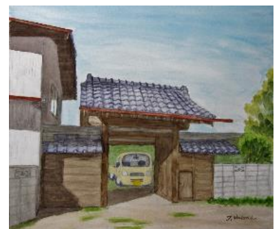
瓦葺・観音開扉・くぐり戸門