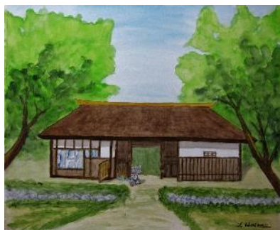
環濠&萱葺き長屋門