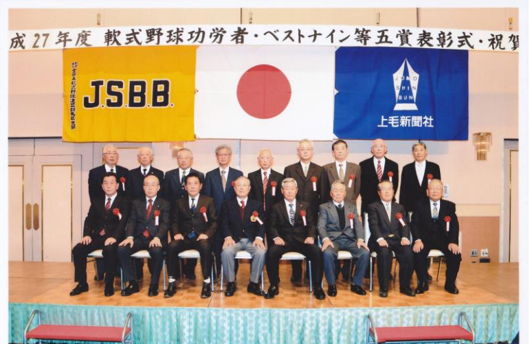
平成27年度 群馬県軟式野球功労者・ベストナイン等五賞表彰式・祝賀会 とき：平成27年12月13日 ところ：マリーキュリーホテル

本投稿の全文と写真を、菱の実会ホームページに掲載しておりますので、ぜひご覧下さい。