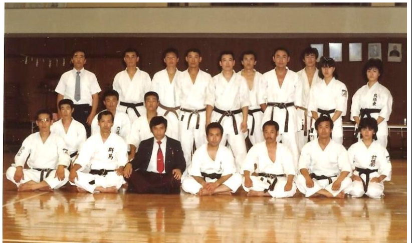
写真上 : 大会後選手と記念写真に納まる筆者 (前列左から3人目)

世界の197ヶ国以上で行われている空手道も2020年の東京オリンピックから正式種目になりました。このような大会に県市から選手が参加出来るように、今後も努力していきたい。