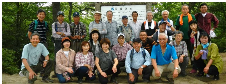
2016年5月 鐘撞堂山 交流ハイキング